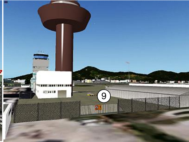
Eingang beim neuen Tower