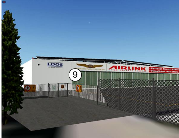
Eingang zum GAC-Bereich

Die Zugangstore zum Flugplatzgelände sind ebenfalls animiert und können über das "HangarOPS-Addon" geöffnet und geschlossen werden (Keycode = 9 für alle Tore):