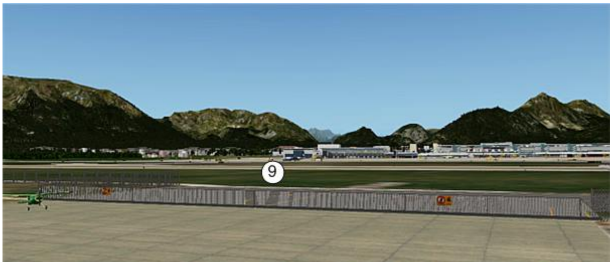
Hangar 7 und 8