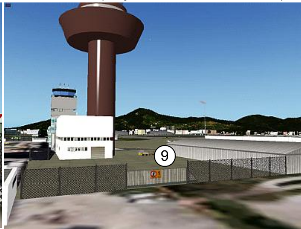
Eingang beim neuen Tower