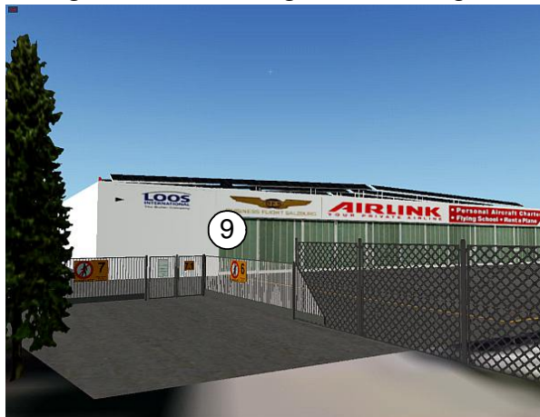
Eingang zum GAC-Bereich

Die Zugangstore zum Flugplatzgelände sind ebenfalls animiert und können über das "HangarOPS-Addon" geöffnet und geschlossen werden (Keycode = 9 für alle Tore):