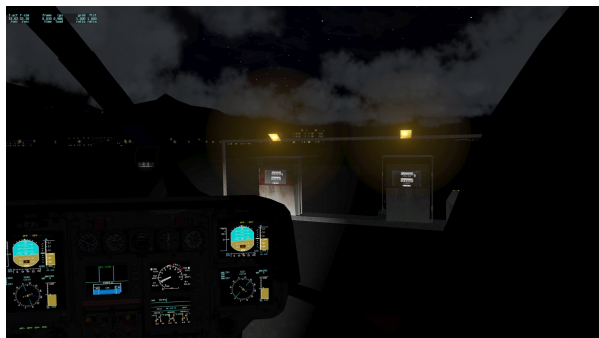
Tankstelle mit Nachtbeleuchtung

Für die Bedienung des Hangars ist das Addon "HangarOps Package" von BlueSideUpBob erforderlich (siehe Credits)